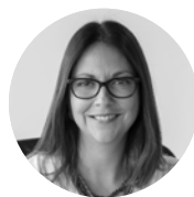
Natalia Piergentili Domenech Subsecretaria de Economía y EMT

De aquello surge el objetivo de nuestro Ministerio, en conjunto con BID, de impulsar el Proyecto Promociona Chile promovido por +Mujeres y la CPC, inspirado en el Proyecto Promociona en España, impulsado por el Ministerio de Sanidad, Servicios Sociales e Igualdad y la Confederación Española de Organizaciones Empresariales (CEOE)”.