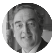
Juan Rosell Lastortas Presidente CEOE

Los éxitos del Proyecto nos han llevado a lanzar la quinta edición en nuestro país y es un orgullo para CEOE poner en marcha el Proyecto Promociona Chile junto con la CPC y el apoyo institucional de los Gobiernos chileno y español, de cara a conseguir que más mujeres y empresas se sumen a esta iniciativa que es ya una realidad global”.